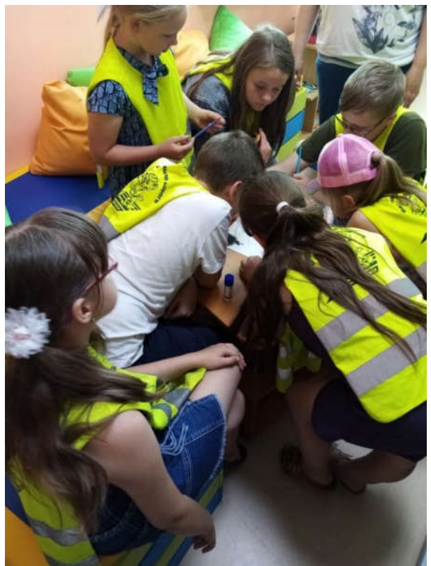
В канун ДНЯ РОССИИ в лагере прошло мероприятие в актовом зале и акция #ОКНАРОССИИ