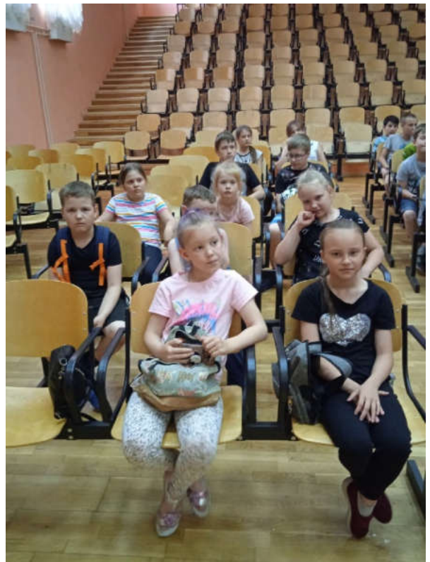
Международный день друзей! - В честь него волонтерское движение "Кукуруза" 🌽 устроили у нас летние игры